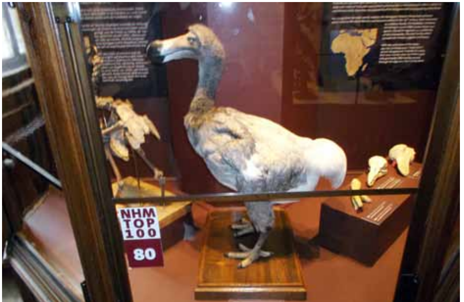
ပြတိုက်အတွင်း ငှက်ပြခန်း၌ ပြသထားသည့် မျိုးသုဉ်းပျောက်ကွယ်သွားသည့် ဒိုဒို ငှက်မျိုးစိတ် ရုပ်လုံးအတူ ပြကွက်