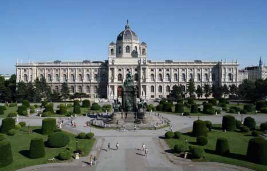
ဩစတြီးရီးယား၊ ဗီယာနာ သဘာဝ သမိုင်းပြတိုက် မျက်နှာစာ အဝေးမြင်ရပုံ (ယာ) သဘာဝ သမိုင်းပြတိုက်အဆောက်အဦ အပေါ်ဆုံး မျက်နှာကျက်တွင် ဘာသာရပ်အလိုက် ပုံဖော်ထားပုံ (အောက်)