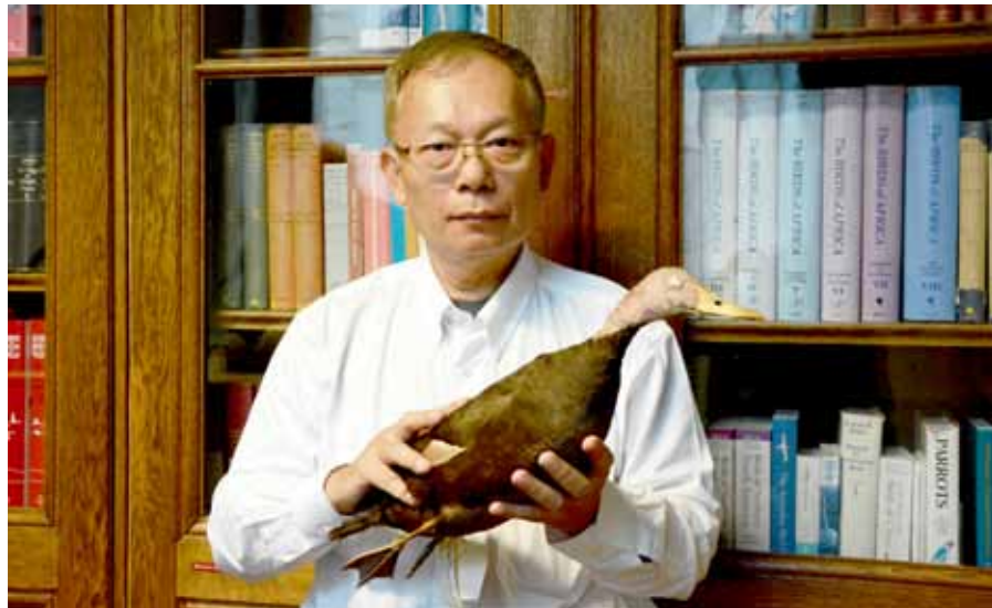
စာရေးသူမှ ဘဲခေါင်းပန်းရောင် ရှပ်လုံးအား အနီးကပ် လေ့လာပြီး၊ အမှတ်တရပုံ (၁) ပြတိုက်အတွင်း ကမ္ဘာ့နို့တိုက်သတ္တဝါ ခြင်္သေ့ မျိုးစိတ် ရှပ်လုံးပုံ (အောက်)

အမည်းရောင် ဖြစ်ပြီး၊ လည်တိုင် အရှေ့ဖက်တွင် သေးသွယ်သည့် အမည်းရောင် ဖြစ်သည်။ စိုးရိမ်ရသည့် မျိုးသုဉ်းမှုအန္တရာယ်ရှိ ဘဲခေါင်းပန်းရောင် နမူနာပုံစံအား အနီးကပ်မြင်တွေ့ ကိုင်တွယ် လေ့လာခွင့်ရသဖြင့် အားရကျေနပ်မိပါသည်။